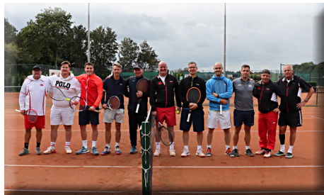
Die erfolgreiche Herrenriege

Die Tennisabteilung freut sich auf die Sommersaison 2024 mit vielen sportlichen Höhepunkten und vielen Zuschauern. Vor allem freuen wir uns auf drei Jugendmannschaften die dann neu am Start sein werden.