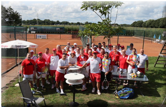
Voll ausgebucht war das 12. Bolten Bitburger BBQ Turnier