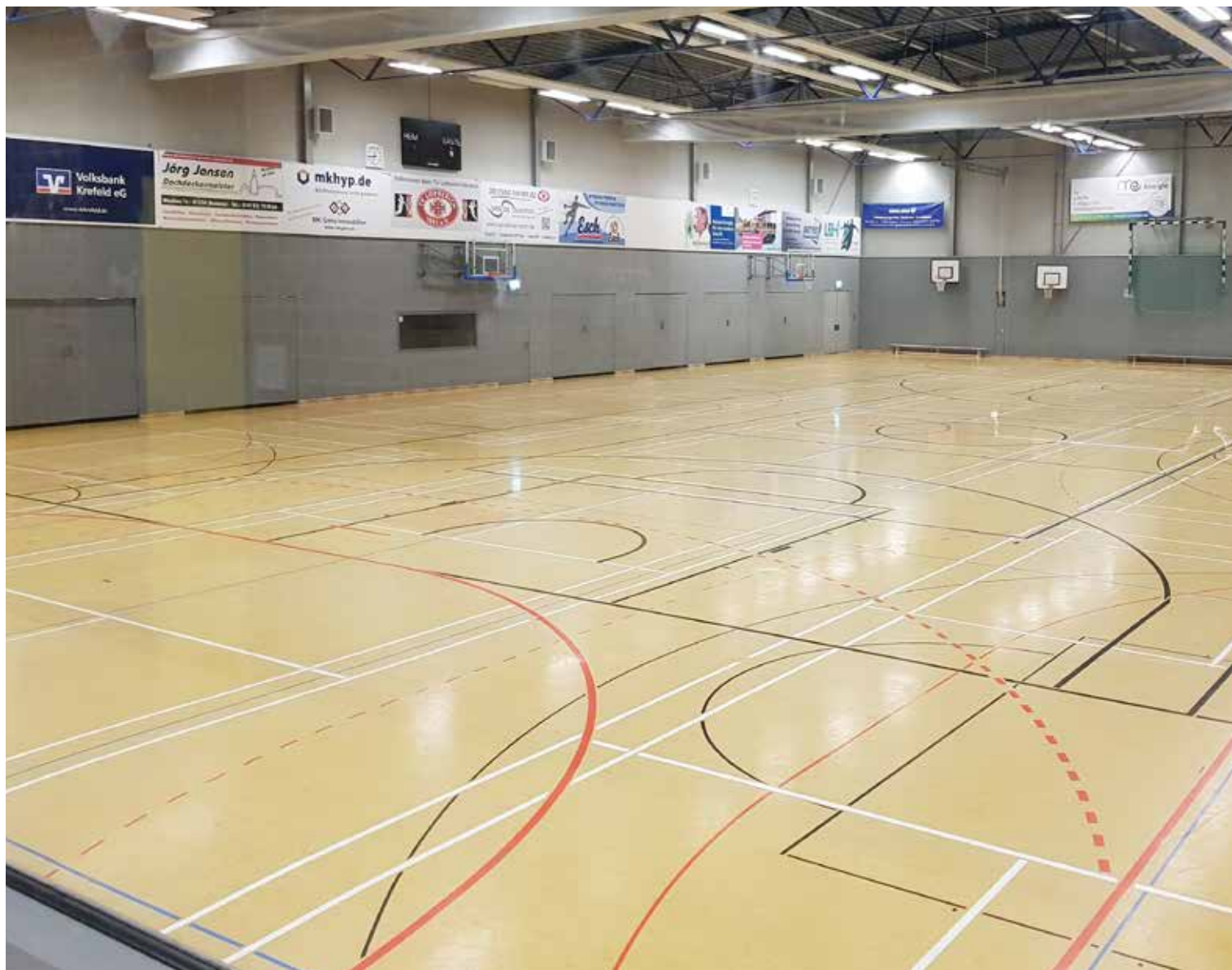
Neue Lackierung für den Hallenboden der Werner- Jaeger-Halle

Die Kosten für die Lackierung belaufen sich auf rund 35.000 Euro. Der Ausschuss stimmte der Maßnahme einstimmig zu.