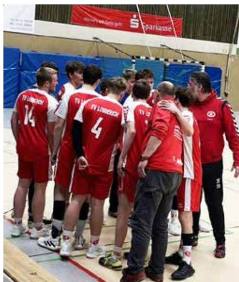
Vor dem Anpfiff